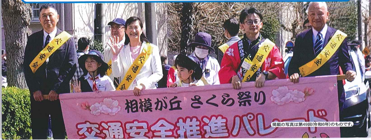
掲載の写真は第49回(令和6年)のものです。

今後ともご理解ご協力を賜りますようお願い申し上げます。貴会の益々のご発展とご健勝を心からお祈り申し上げます。